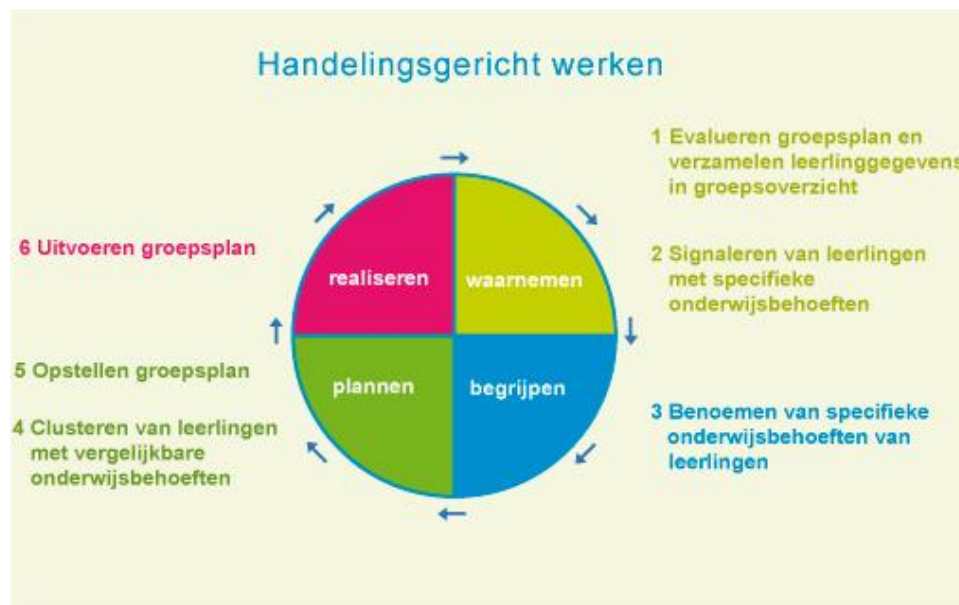
Figuur 1. Cyclus van handelingsgericht werken.

De uitgangspunten van het handelingsgericht werken komen zowel bij groepsgewijze als individuele toepassing tot uitdrukking door het volgen van de HGW-cyclus.