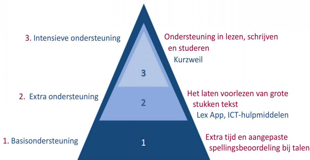
Figuur 2. Zwaarte dyslexie en ondersteuning.

Na het gesprek met de leerling worden de faciliteiten vermeld op een dyslexiekaart. De gegevens van deze kaart en een korte weergave van het gesprek staan vermeld in het dossier van de leerling (Magister). Aan het einde van het schooljaar volgt nog een gesprek met de dyslexiecoach. Voor de leerlingen met dyslexie gelden compenserende faciliteiten in overleg met de coach. Zo kun je denken aan: